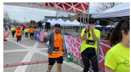
L'équipe POP en tee-shirts jaune/orange lors de la course d'avril 2023